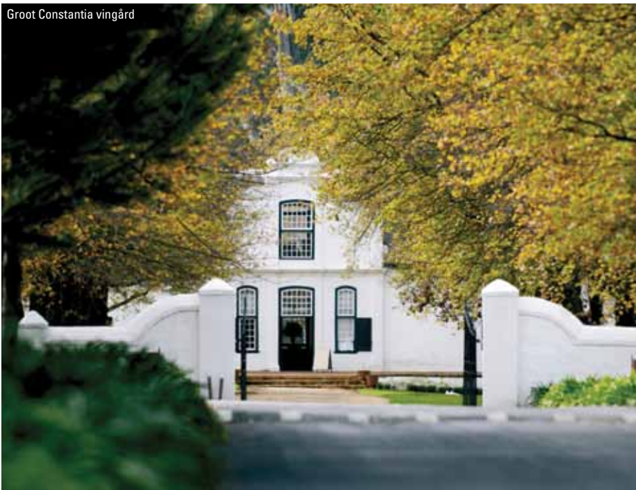
Groot Constantia vingård