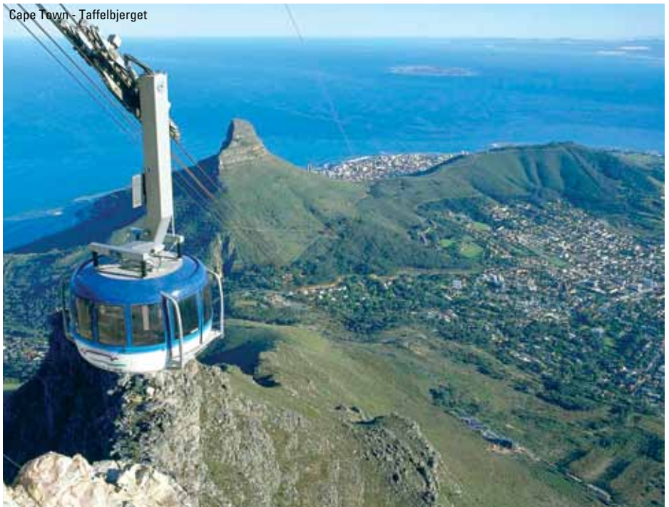
Cape Town - Taffelberget

mere om på en rigtig lokal og fungerende strudsefarm. Her kan vi handle diverse souvenirs som fjer, æg og skind. Vi bliver præsenteret for hele produktionsforløbet og skal også opleve et strudsekapløb. Du må veje mindre end 75 kg for at kunne ride på en struds. Vi spiser sen frokost på farmen - naturligvis med struds på menuen. Senere kan du ose lidt rundt i byen inden vi checker ind på hotellet. Her er der afslapning resten af dagen og dejlig husmandskost om aftenen. Overnatning: De Oude Meul ell. lign. (M,F,A)